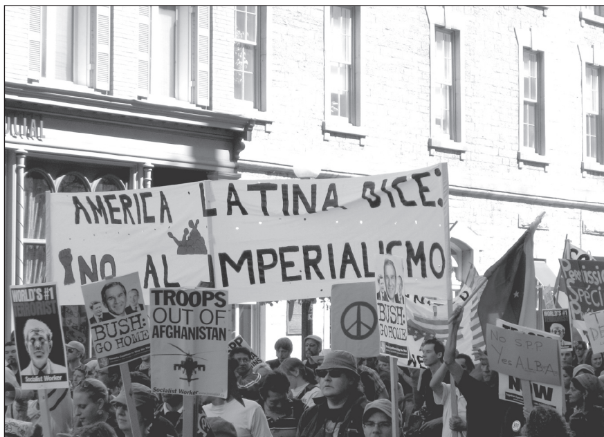
Los manifestantes de Canadá, de EUA y de México se unen contra ASPAN en Montebello (izquierda) y Ottawa (derecha). México se unen contra ASPAN en Montebello (izquierda) y Ottawa (derecha).

Los pueblos dan la bienvenida a las relaciones comerciales y de todo tipo, que se caracterizan por el beneficio mutuo y el respeto de los derechos, incluyendo la soberanía de las naciones. Pero estos acuerdos del ASPAN sirven a los más grandes monopolios y golpean la unidad fraterna de los pueblos. No tienen cabida en las sociedades modernas.